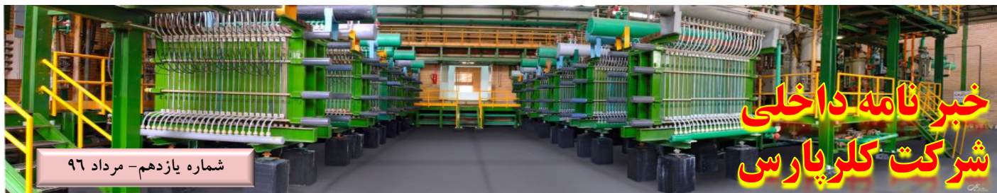
شماره یازدهم - مرداد ۹۶